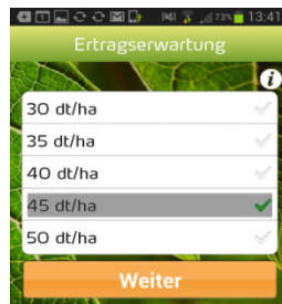
Abbildung 2: Bildschirmfoto der Smartphone Applikation Image IT®; hier: Auswahl des zu erwartenden Ertrags.